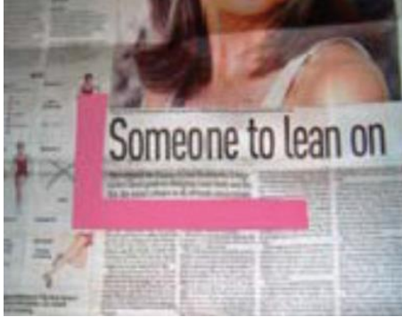
Teclynnau amlygu llinellau